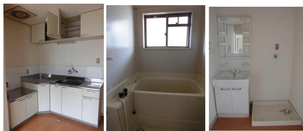
間取図は現況優先